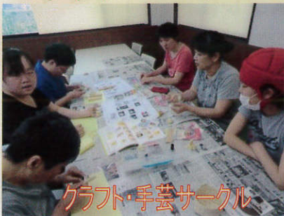
クラフト・手芸サークル