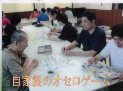
自家製のオセロゲーム

作業の空いた時間に、皆で楽しくゲームや体操をしたりして日頃の疲れを解消します。今回はカルタ取りと自家製のオセロゲーム、またウォーキングマシン、足マッサージャーで心身ともにリフレッシュ!