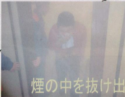
煙の中を抜け出す訓練