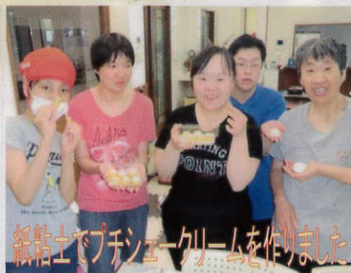
紙粘土でプチシュークリームを作りました

今年の6月から手芸・スポーツ・読書サークルが始まりました。手芸サークルでは、紙粘土でプチシュークリームを作りました。スポーツでは、扶桑緑地公園まで歩き、いい汗を流しました。読書では、図書館や漫画喫茶などに行く予定です。