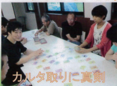
カルタ取りに真剣