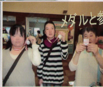
メダルと参加賞をゲット!