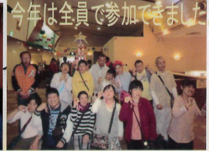
今年は全員で参加できました。